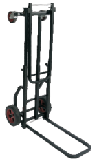
Deep Equipment Hand Truck