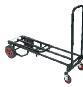
Long Equipment Platform