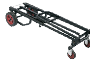
Long Equipment Dolly