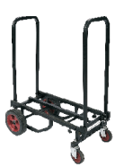
Short Equipment Truck