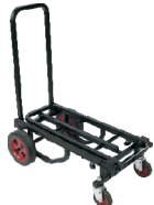
Short Equipment Platform