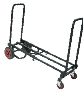
Long Equipment Truck